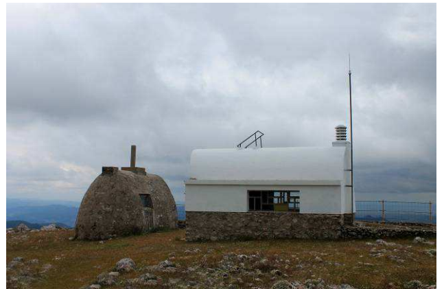
Caseta de Vigilancia de Andalucía