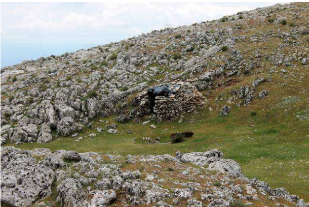
Llegando a la Caseta de Vigilancia de Andalucía