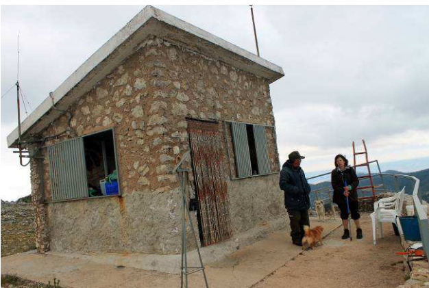
Caseta de Vigilancia de Castilla la Mancha