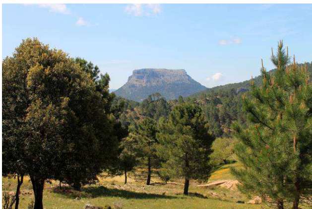
Vista del Cambrón desde la subida a la Sarga

Según nos adentramos en la plataforma del calar, la senda pierde algo de definición. Por ellos seguiremos las marcas que encontraremos en hitos de piedra, pinos y soportes de las placas que marcan los límites del Parque Natural con. En lo cimero de esta plataforma existen dos casetas vigilancia de incendios, la 1ª pertenece a Andalucía y desde la misma se divisa una fantástica panorámica que abarca desde las llanuras manchegas de Ciudad Real y Albacete hasta Sierra Nevada. Cruzando al otro extremo del calar hay otra caseta perteneciente a Castilla-La Mancha. Regresamos por el mismo camino y habremos recorrido 17,9 km