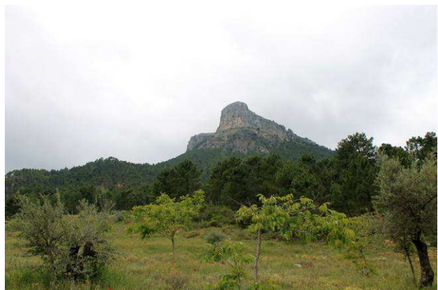
Otra vista del Cambrón