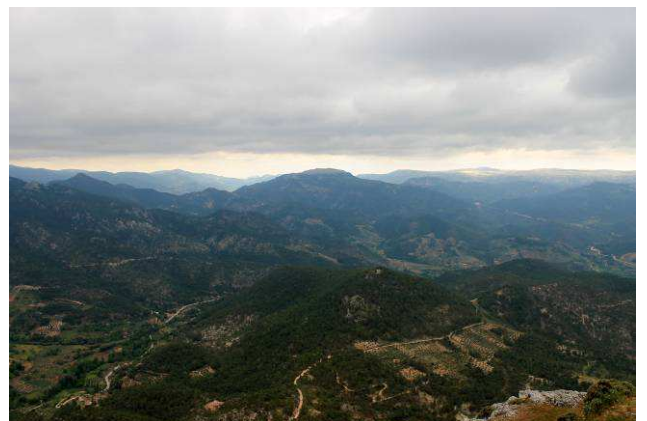
Panorámica desde el Cambrón