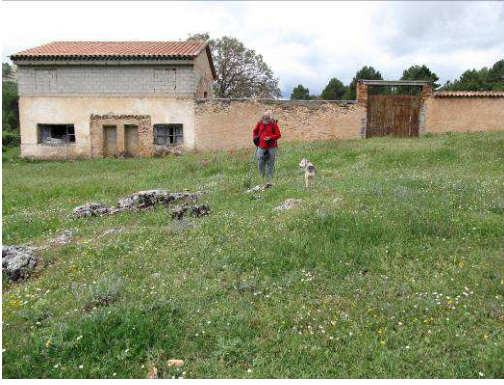
Cortijo del Manojal