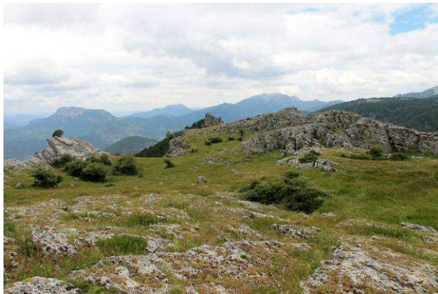
Por la cuerda del Gallinero