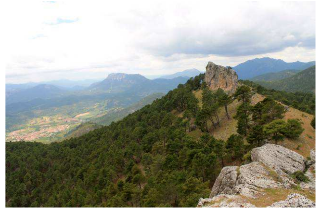
En la cuerda del gallinero