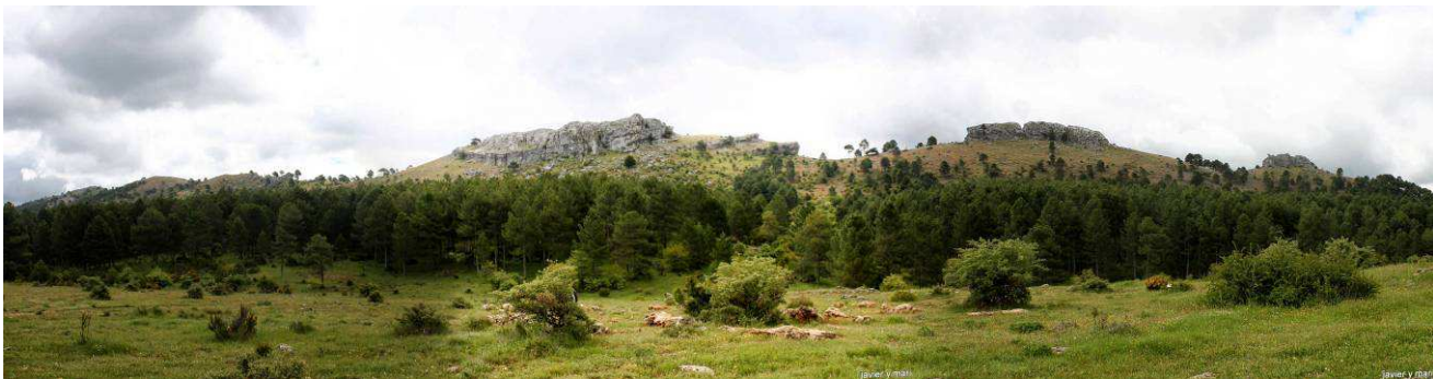
Panorámica de la Cuerda del Gallinero

Partimos del pueblo de Riópar en dirección all Gollizo, donde dejamos el coche, así evitamos la zona de asfalto, a la salida del Gollizo nos metemos por una vaguada através de la cual llegamos al cortijo de la Limonera, a la fuente de los Cerezos y al Cortijo del Manojal. Desde este lugar ya divisamos la cuerda del Gallinero, hacia donde nos dirigimos por un sendero bien marcado, al principio, que luego se pierde, una vez en la cuerda recorremos la misma de derecha a Izqda hasta llegar al alto del Gallinero desde donde contemplamos unas magnificas vistas de los picos del Oso y el Calar, del Padroncillo y de las Almenaras, y ya desde el pico avanzamos hasta llegar señalización del PR (pequeño recorrido)-AB-35 y de aquí al Pino Gordo del Toril, volviendo a las señalizaciones podemos ir hasta el alto de Peralta, que luego desandaremos para para tomar la dirección de Paterna Madera hasta encontrarnos con nuevas señalizaciones, seguimos la que se dirige hacia el alto de las Crucetillas hasta llegar al cortijo del Manojal donde ya retomamos el sendero de la subida. Total del recorrido 18,75 km