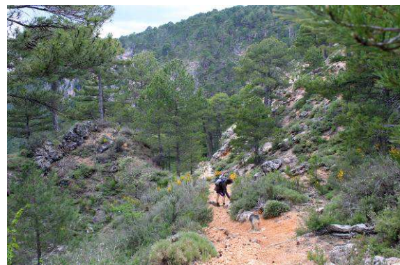
Camino del Cortijo del Manojal