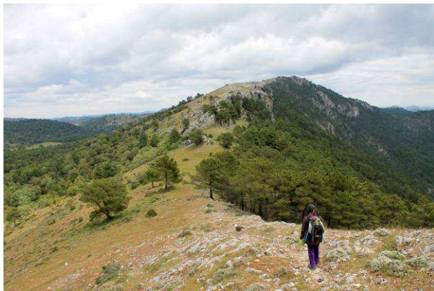
Camino del Gallinero