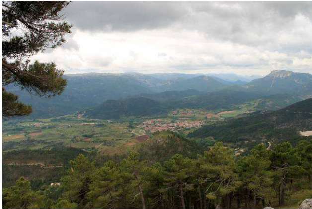
Riópar desde la cuerda del Gallinero