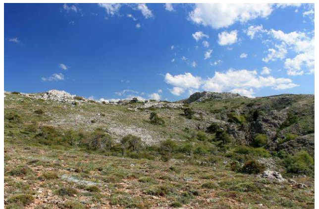
Vista del Calar del Mundo