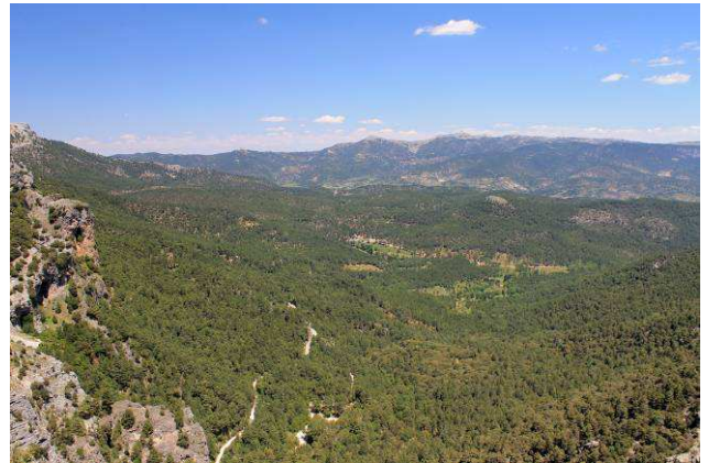
Valle de Nacimiento del Rio Mundo desde el Mirador