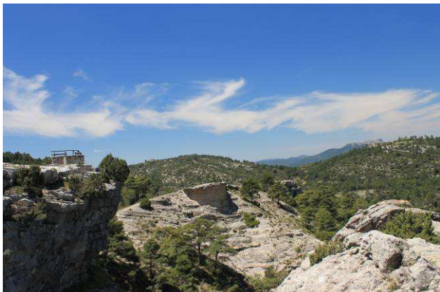
Mirador del Nacimiento