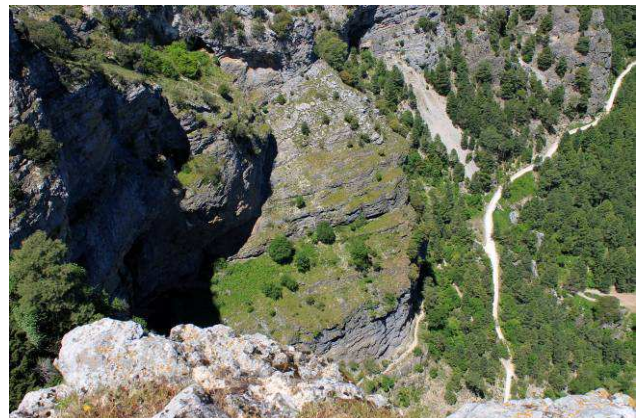
Nacimiento del Rio Mundo desde el Mirador