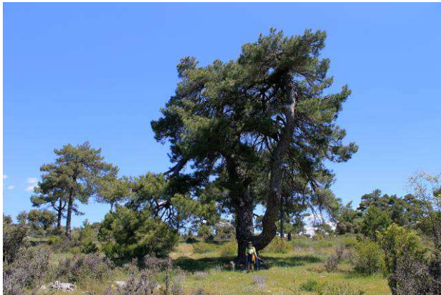
Camino del Mirador