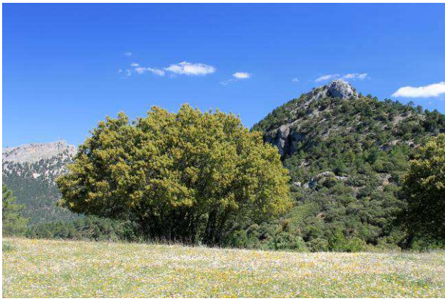
Camino del Mirador