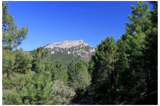
El Cambrón desde el camino del Miador