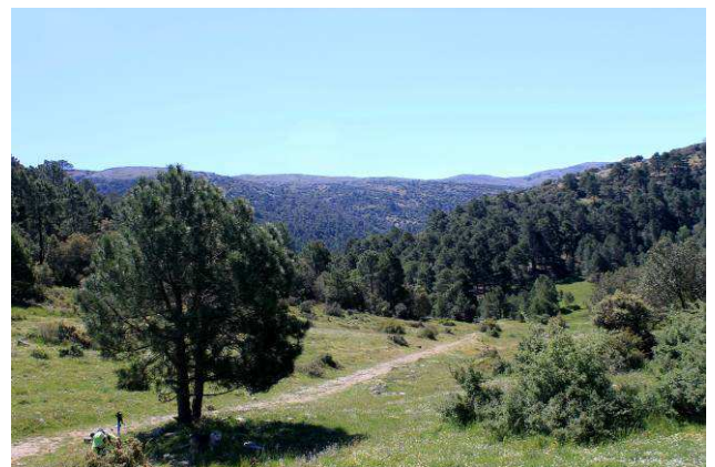
Camino del Mirador