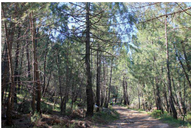
Camino del Mirador en las proximidades del Arenal

Esta ruta la iniciamos en el Puerto del Arenal a través de una senda amplia por un bosque de pino pináster o resinero que va poco a poco convirtiéndose en un bosque de encinas y pinos, hasta llegar a un prado conocido como el Navacico. desde esta primera subida se contemplan la Piedra del Cambrón, La Sarga y el Padroncillo. Desde el estrecho del Navacico pasamos hasta la Cañada de los Mojonos. Una vez en el mirador, nos recreamos con el valle del Rio Mundo situado a nuestros pies y contemplamos así mismo las cumbres más notables, como la del las Almenaras. Desde el Mirador sale un sendero por el que sin ninguna dificultad se accede al Calar del Mundo. Es una ruta de unos 15,5 km (ida y vuelta)