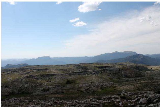
Vista del Calar del Mundo